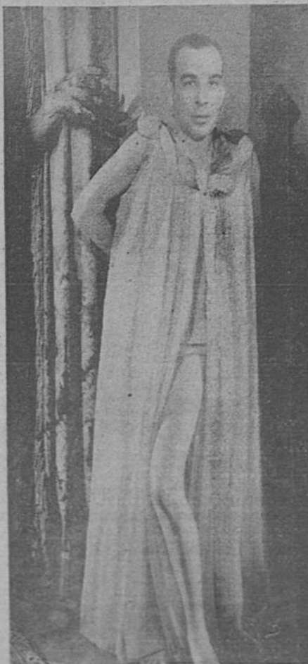
Que no nos ataquen yo pido pues me da rabia enconada, cuando de todos es sabido "que no estamos haciendo nada..."