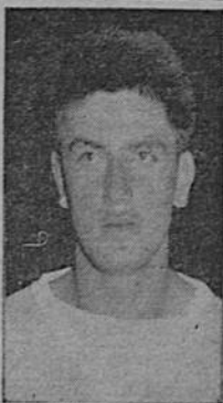
CITY MONGE Hoy reaparece dirigiendo la atacante del Saprissa.

En nuestra edición del martes brindaremos a nuestros lectores amplios informes acerca del desarrollo de estos eventos del deporte de los bates.