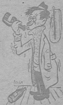
ANTES QUE LLEGUE EL PLAN RESS... ME TOME TRES...

—Será Pérez, que perorará... —Es mi amado Juan, que mi esposo amado... —Tramé de Aquino que aquí no Tomé... —Pero sí lo mismo por libertarista y hacer mesa limpia.