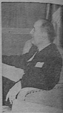
EX-PRESIDENTE Lic. Mario Echandi

COMENTARIOS SOBRE LA CREACION DEL INSTITUTO COSTARRICENSE DEL CAFE.— En el proyecto enviado por el PASA A LA PAGINA CINCO